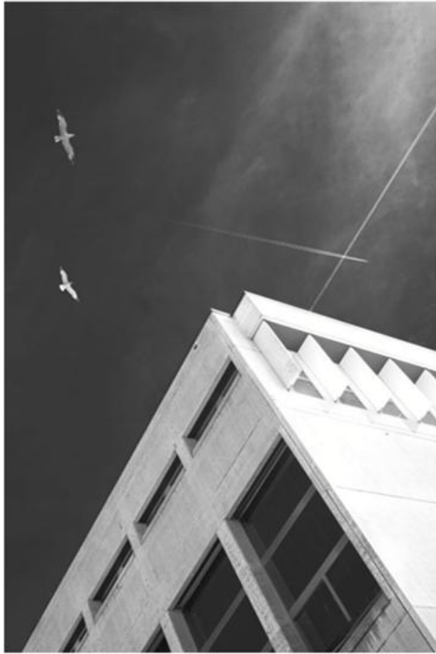
Garraud Gilles 17,19,20