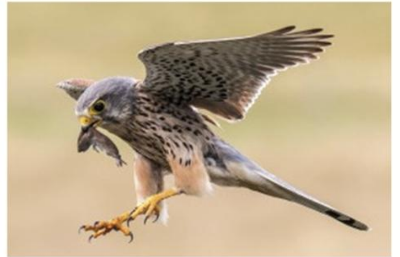
44 Dominique Girod