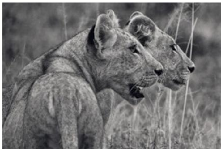
44 LECONTE Dominique