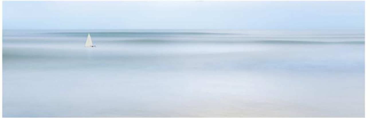
Fourchaud Danielle 19,18,14