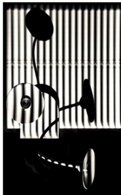
Fourchaud Danielle 20,16,18