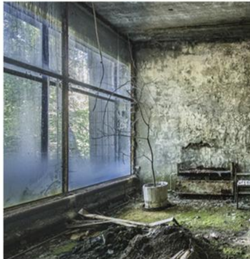
44 Gilles Garraud