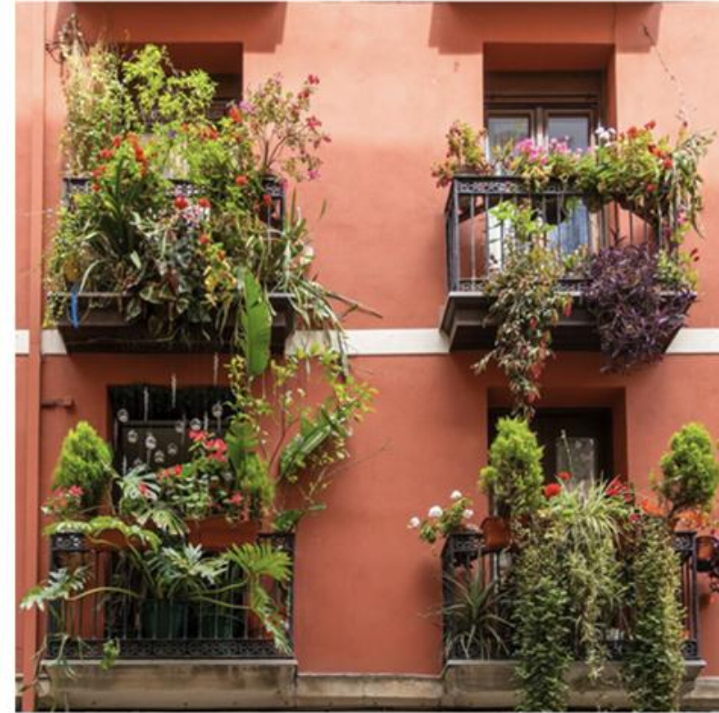
Bruno Suignard 18,15,14