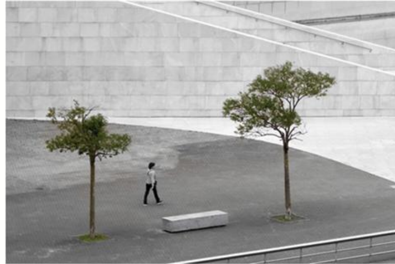
Bruno Suignard 15,14,19