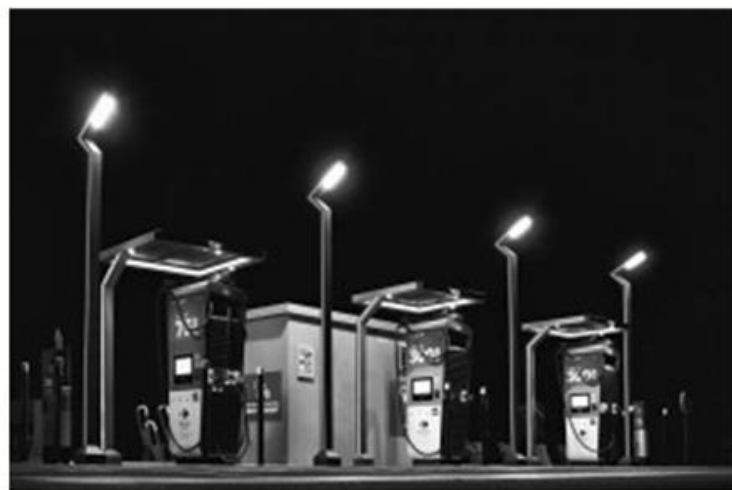
51 NEAU Pascal

Concours Papier monochrome National 1 de la Fédération photographique de France (FPF) Le Club termine 6e (sur 46 Clubs participant) et monte donc en Coupe de France l'année prochain