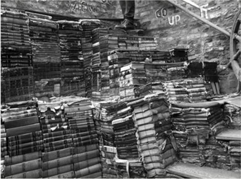
Bruno Suignard 20,20,12