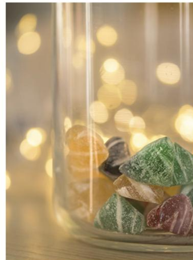
Agnès Hulin 16,12,13