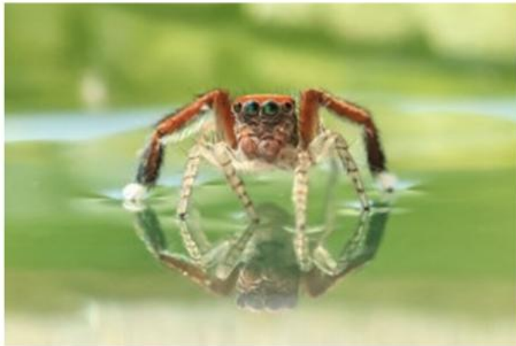
45 Bruno Suignard