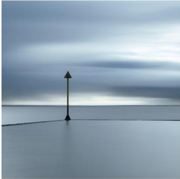
Garraud Gilles 20,20,19